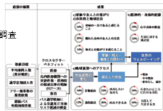
既往研究（香川県小豆島）におけるTOCの把握