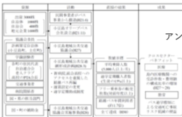
既往研究（香川県小豆島）で設定したTOC